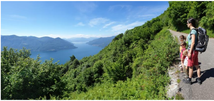
3) auf der geteerten Strasse bis Pozzuolo