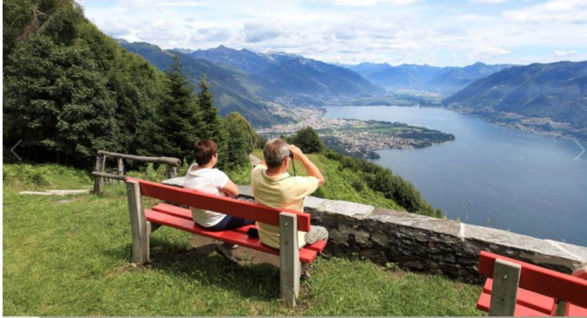
4) Aussicht von Pozzuolo