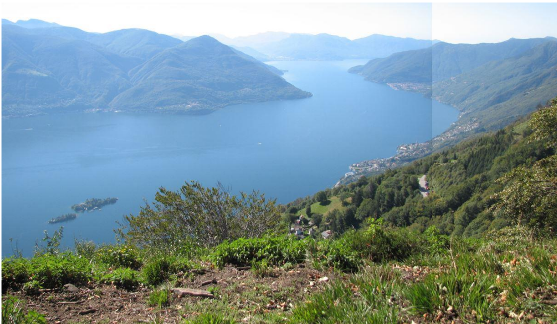
6) Aussicht vom Höhenweg nach Italien