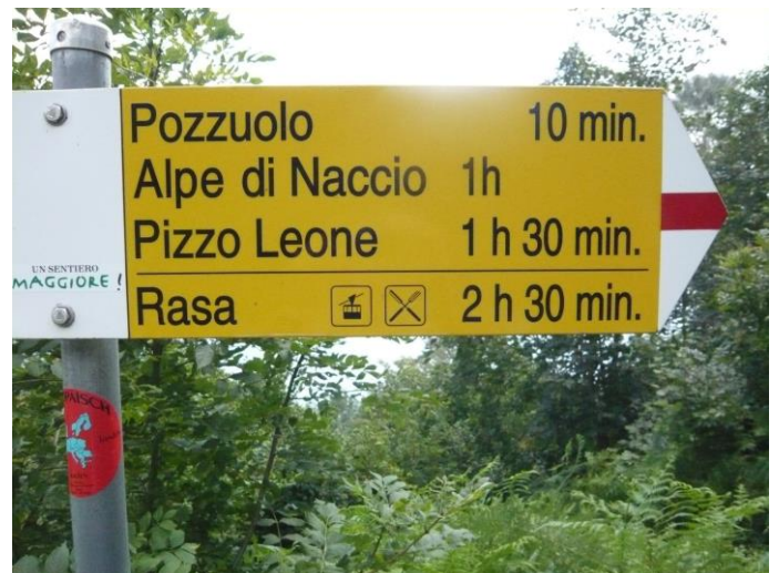
2) Wegweiser, Strasse in dieser Richtung hinauffahren