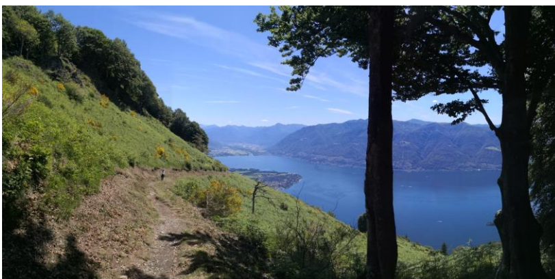
7) Aussicht beim Abstieg