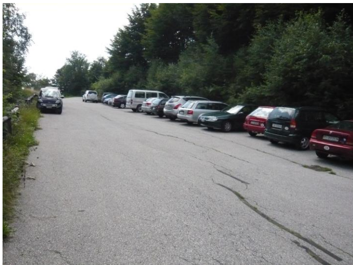
1) der grosse Parkplatz vor der Barriere